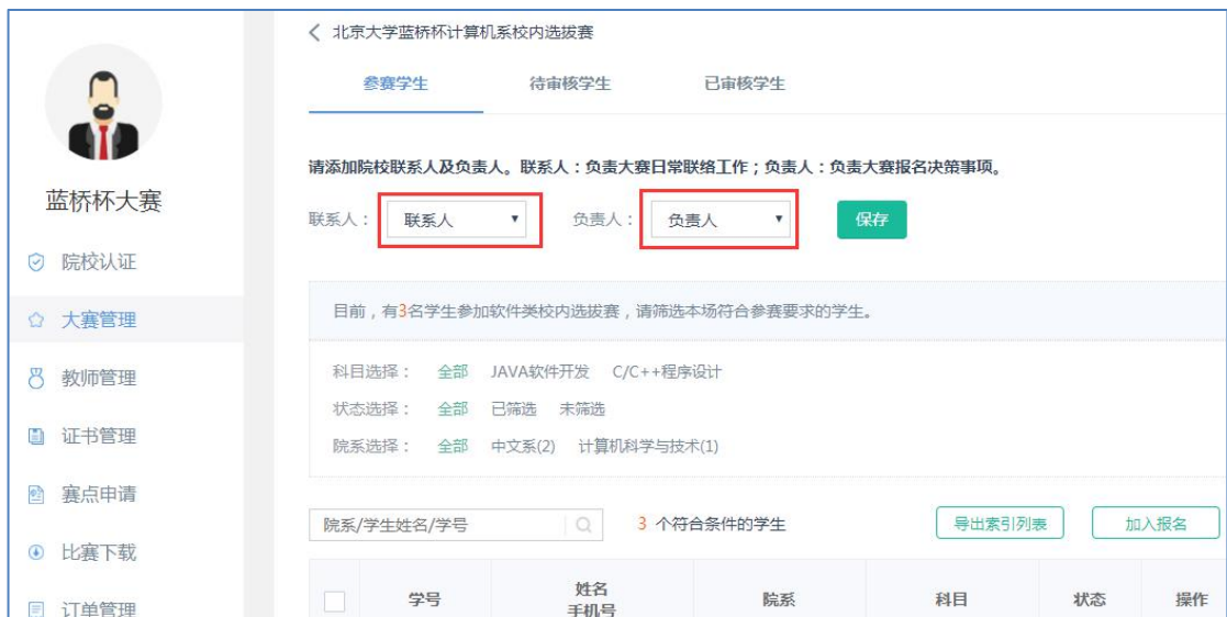
1.23 添加联系人、负责人

院校管理员需要对报名本校模拟赛的学生进行筛选。院校创建完成某场模拟赛，点击进入【参赛学生列表】页面，可以看到本校所有报名的符合本场考试的学生列表。院校需要添加本场考试的院校联系人、负责人，方便组委会联系。