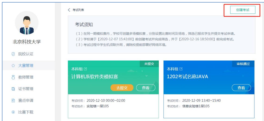
1.20 点击【创建考试】按钮，创建模拟赛考试