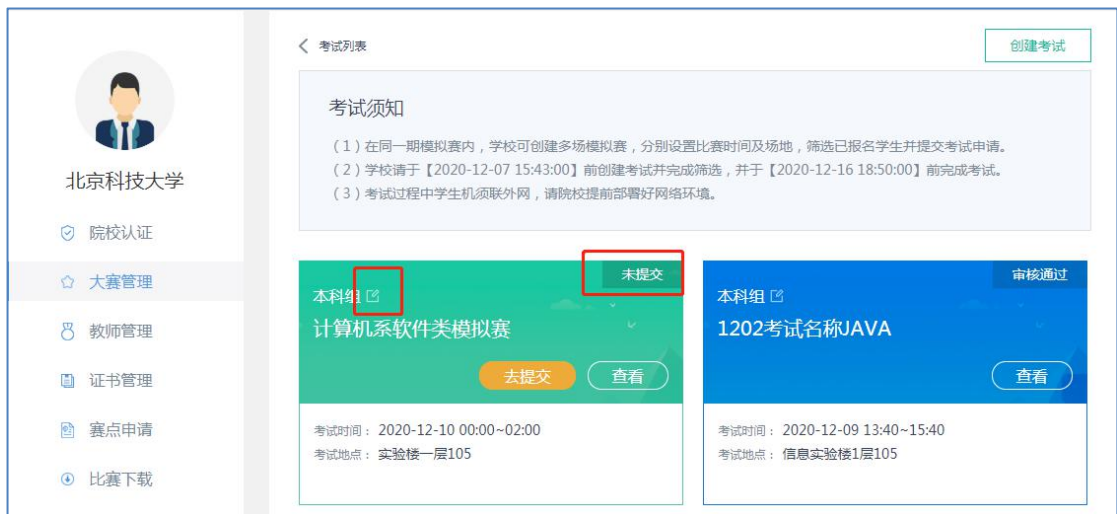
1.22 院校创建的模拟赛考试列表