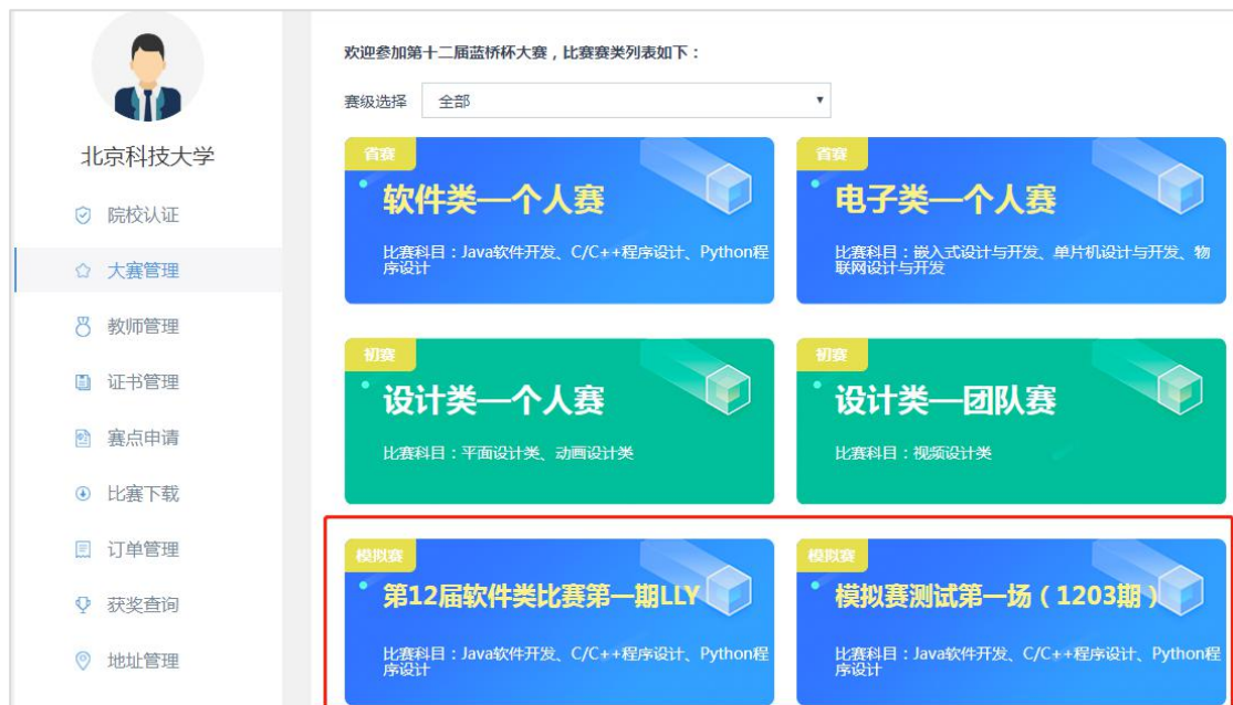
1.19 院校【大赛管理】中选择软件类模拟赛

软件类模拟赛需学校统一组织报名、考试。院校如果需要申请参加蓝桥杯软件类模拟赛考试，首先，需要登录蓝桥杯大赛报名系统进行注册并完成认证。后台认证通过后，院校可以在个人中心【大赛管理】栏目，选择软件类模拟赛中的某场比赛，点击进入模拟赛考试申请页面。